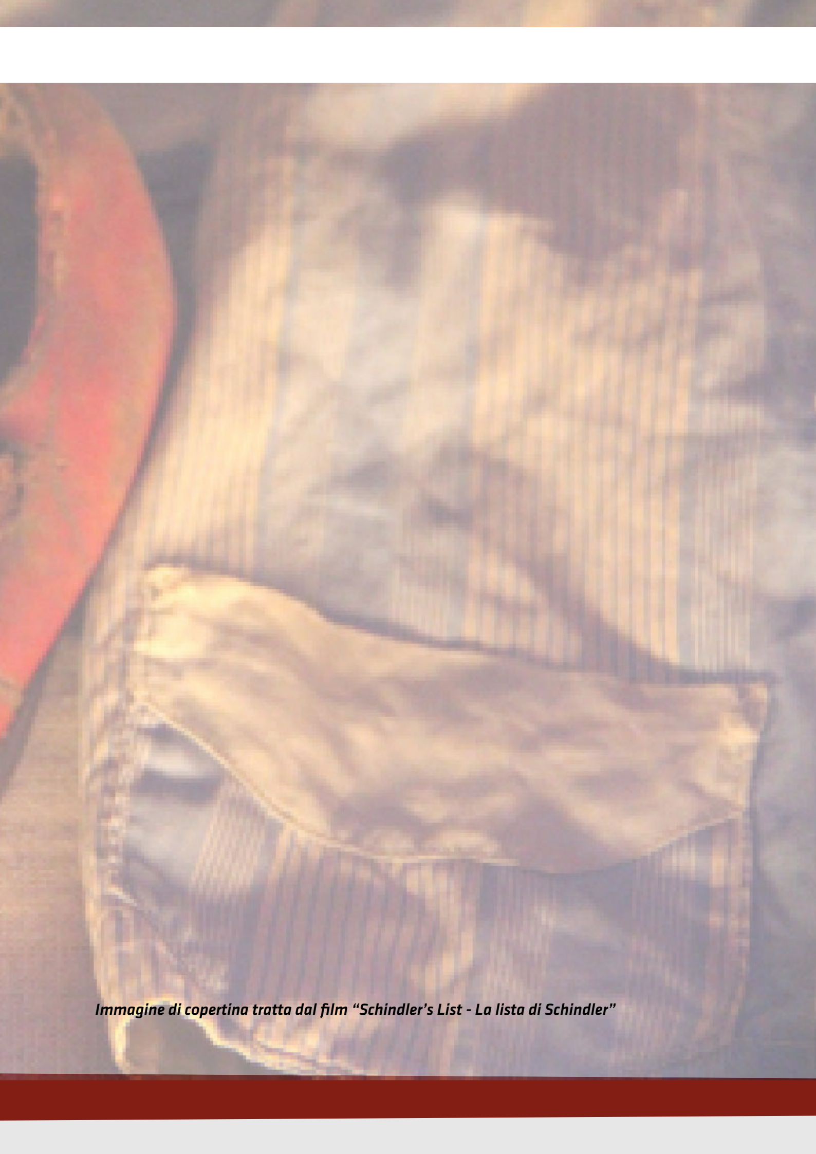
Immagine di copertina tratta dal film "Schindler's List - La lista di Schindler"