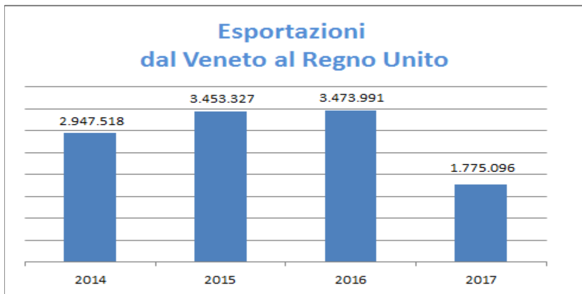
Grafico n. 2 - Esportazioni dal Veneto al Regno Unito 2014 – 2015 – 2016 – Giugno 2017 (Dati in migliaia di euro)

Ecco il Veneto che esporta nel Regno Unito nella serie storica dal 2014 al 2017 nel Grafico n. 2. Come si può vedere le esportazioni hanno una tendenza ad essere stabili, confortante il dato di giugno 2017.