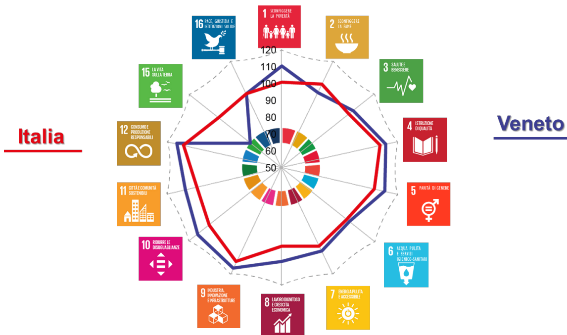
Figura 3. Il Veneto nel confronto con l'Italia. Indicatore composto per obiettivo – Anno 2017