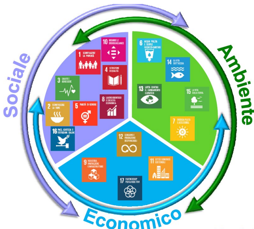
Figura 1. I 17 Goals raggruppati nelle tre dimensioni: economica, sociale, ambientale

Alle tre componenti di cui sopra, si aggiunge la quarta componente, quella istituzionale , ossia la capacità dei diversi enti di governo e degli attori della società civile di creare valore addizionale, al fine di accrescere il livello di benessere delle comunità.